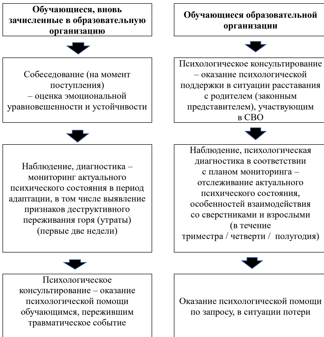
Схема выстраивания работы педагогов-психологов / психологов по психологическому сопровождению детей ветеранов (участников) СВО в зависимости от статуса пребывания обучающегося в образовательной организации

Каждое направление деятельности педагога-психолога / психолога включается в единый процесс сопровождения, обретая свою специфику, конкретное содержательное наполнение в форме программ адресной помощи (далее – психолого-педагогические программы) с учетом выявленных психолого-педагогических проблем, рисков и трудностей обучающихся целевой группы.